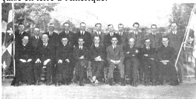
Voici les fondateurs de la Société Saint-Jean-Baptiste du diocèse de Nicolet en 1944.

Il y a soixante ans, les 26, 27 et 28 mai 1944, à Drummondville, huit Sociétés Saint-Jean-Baptiste autonomes (Saint-Frédéric, Saint-Joseph, Saint-Simon et Sainte-Thérèse à Drummondville ainsi que Nicolet, Saint-Cyrille, Saint-Léonard-d'Aston et Victoriaville) fusionnent en une seule, la Société Saint-Jean-Baptiste du diocèse de Nicolet , qui deviendra en 1986 la Société Saint-Jean-Baptiste du Centre-du-Québec. Depuis lors jusqu'à aujourd'hui, année après année, la Société se dévoue avec ténacité à l'affirmation du fait français à la grandeur de la région et à travers le Québec tout entier, contribuant ainsi à la survivance française en terre d'Amérique.